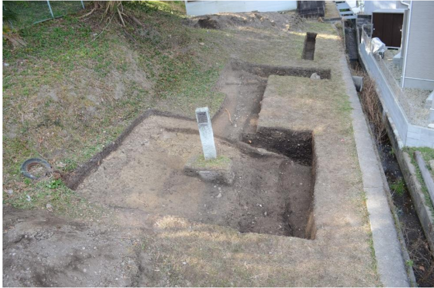
過去の調査区検出状況