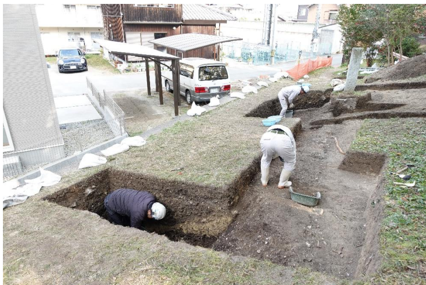
調査現場作業風景