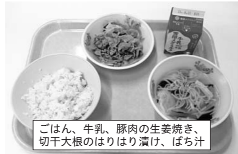
ごはん、牛乳、豚肉の生姜焼き、切干大根のはりはり漬け、ばち汁