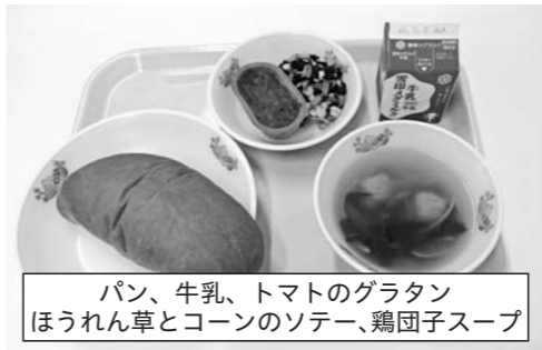
パン、牛乳、トマトのグラタン ほうれん草とコーンのソテー、鶏団子スープ