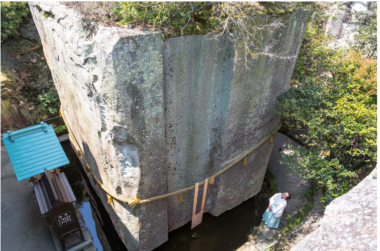
石の宝殿（生石神社）