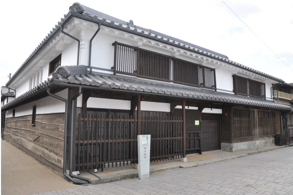
工樂松右衛門旧宅（高砂町）