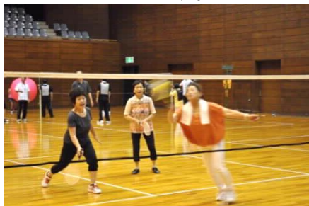
ファミリーバドミントン