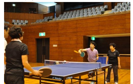
スーパードライブ