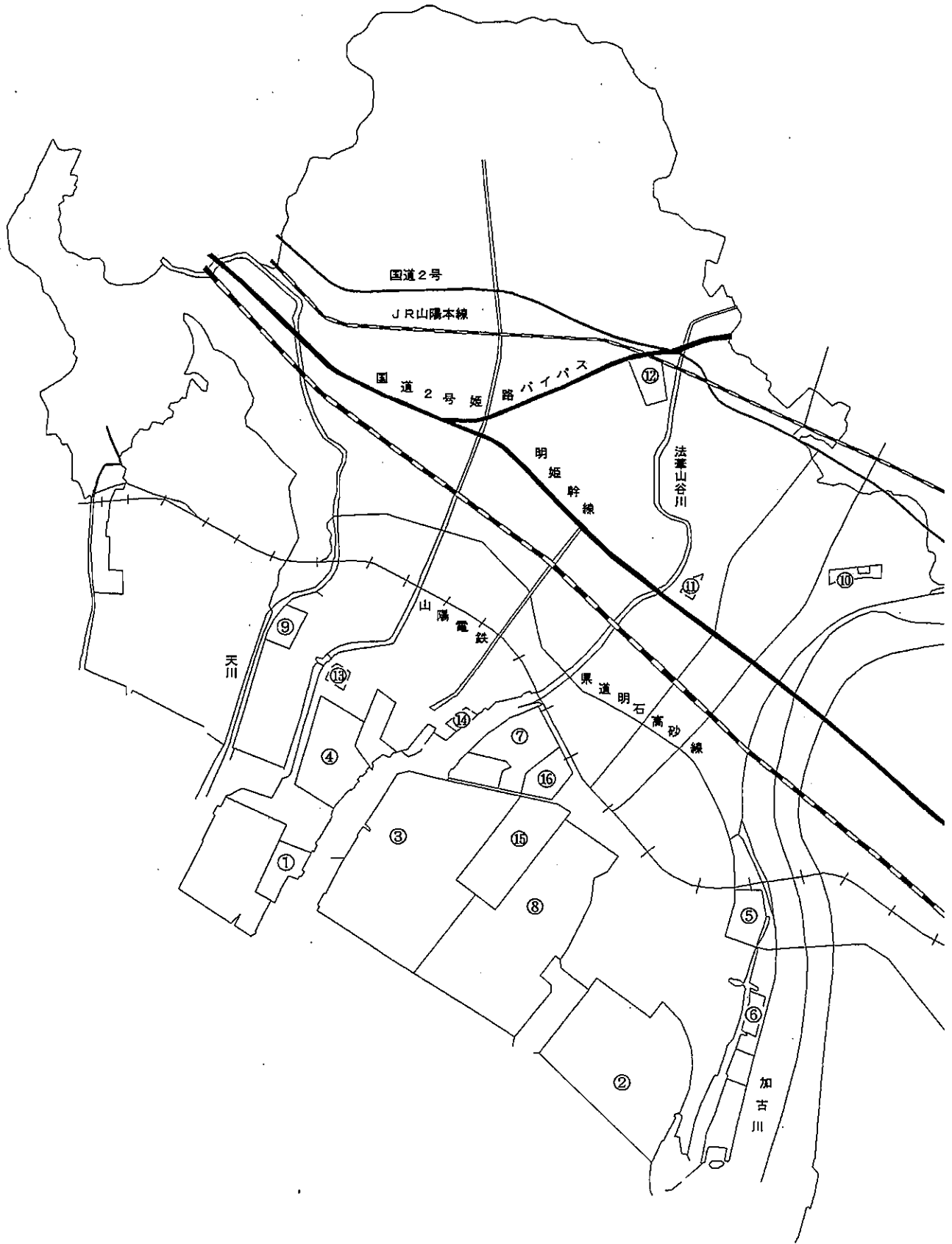
図 2-1 環境保全協定締結工場位置図