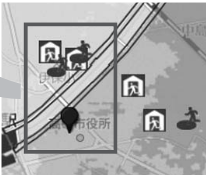
拡大して一つひとつの建物や経路を確認できます。