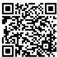
高砂市WEB版ハザードマップ (市ホームページ)

各種災害に備えるために役立つ「高砂市WEB版ハザードマップ」を市ホームページで公開しています。 下記のQRコードを読み取るか、市公式スマートフォンアプリ「たかさこナビ」の防災ボタンをタップして利用してください。 高砂市WEB版ハザードマップを活用して、次のことを確認しておきましょう。