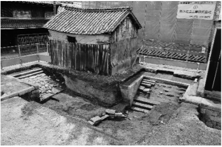
北前船が寄港した高砂港の物流を担った高砂堀川遺構

江戸時代に使われていた堀川護岸の石垣や、舟から荷物を揚げ降ろしする雁木という階段など、船着場の遺構が良好に保存されています。また、北前船が寄港した高砂港の近くには謡曲「高砂」ゆかりの地である高砂神社があり、境内には、北前船が高砂港に入る目印としていた石造の常夜灯が現在も残されています。