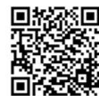
基礎疾患の範囲(市ホームページ)

※ 予約時に、該当する基礎疾患をお伝えください。 ※ 基礎疾患の範囲について詳しくは、市ホームページをご覧ください。