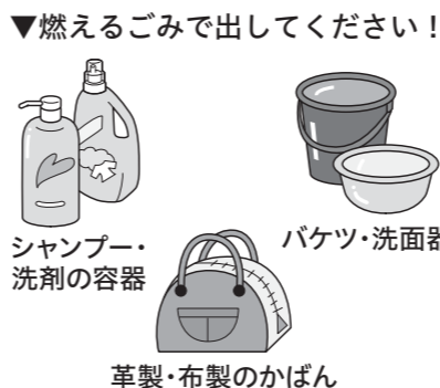
▼燃えるごみで出してください！

出されているケースが多く見られます。プラスチックやビニール、ゴム、革などの燃える素材で、45リットル以下のポリ袋に入る大きさのものは、燃えるごみで出してください。燃えないごみで処理した場合、燃えるごみの約4倍もの処理費用がかかります。