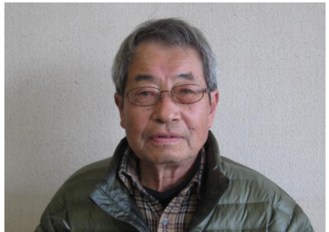
明姫幹線南地区まちづくり協議会

つきましては、当協議会が創設されてから十数余年が経過しており、会員の高齢化と担い手の不足等による農地利用変更（資材置場）が増加している現状を考慮し、さらに過去の経緯の反省とややマンネリ傾向にある現況の活動状況を好転させるために、今後の課題、指針について来年度中にアンケート調査を実施いたしますので、ご協力のほどお願い申し上げます。