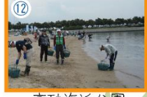
高砂海浜公園 向島公園