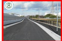
市道沖浜・荒井幹線