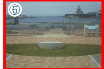
高砂みなとの丘公園