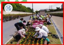
あらい兵風公園オーナー花壇の植栽のようす