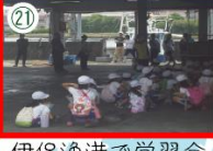
伊保漁港で学習会