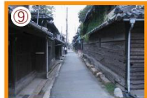
工業家周辺の路地