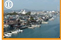
堀川周辺のようす