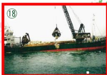
荒井沖合いのようす