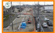
県道沖浜・平津線