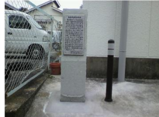
美濃部達吉生家跡 (市まちづくり部設置)