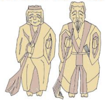
高砂市のシンボル劇と焼

ヤマモモは潮風に強い常緑の高木で、生命力みなぎるその様と真っ赤な果実は高砂市の活力向上のイメージにつながるので、高砂みなとまちづくり構想のシンボルとして位置付けました。