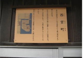
町名由来看板 (西宮町)