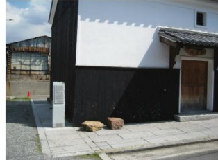
北堀川界隈 (市まちづくり部設置)