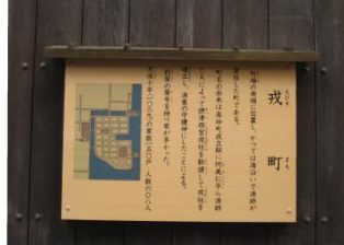
町名由来看板 (戒町)