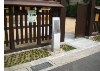
申義堂 (市教育部設置)