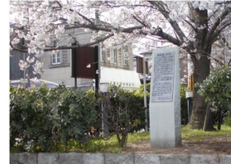
国鉄高砂駅跡 (市まちづくり部設置)