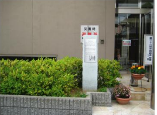
申義堂跡 (市教育部設置)