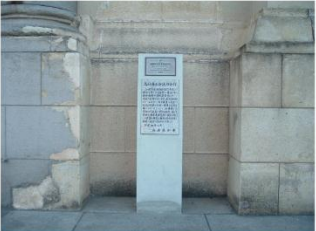
商工会議所 (商工会議所設置)