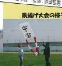
麻揚げ大会の様子