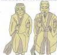
高砂市のシンボル船と燈

ヤマモモは潮風に強い常緑の高木で、生命力みなぎるその様と真っ赤な果実は高砂市の活力向上のイメージにつながるので、高砂みなとまちづくり構想のシンボルとして位置付けました。