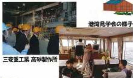
港湾見学会の様子