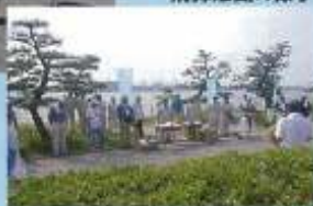
踊こまつりの風景!