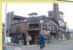
サイン計画まち歩き 高砂町