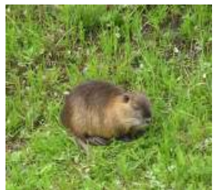
鹿島川に生息しているヌートリア!?