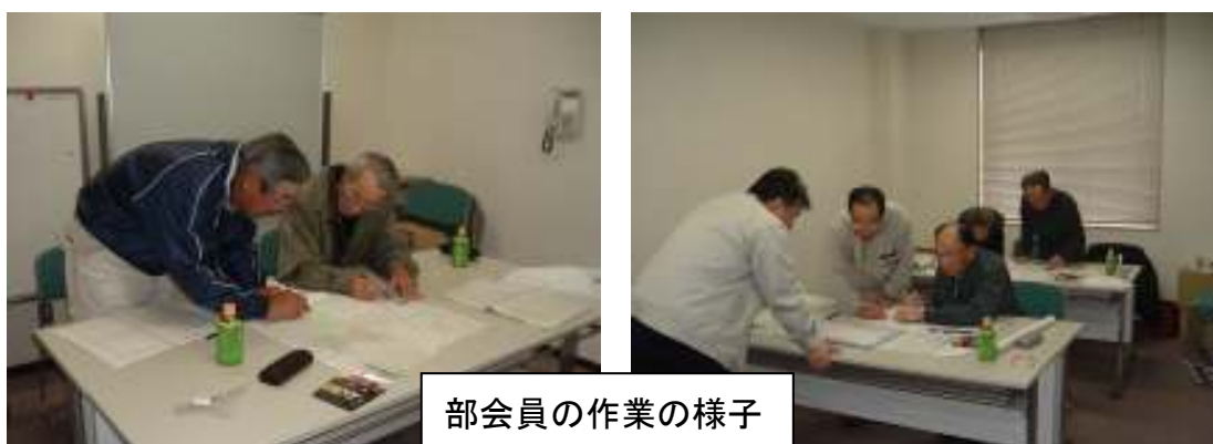
部会員の作業の様子