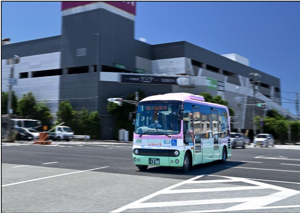
中島交差点を快走するじょうとんバス