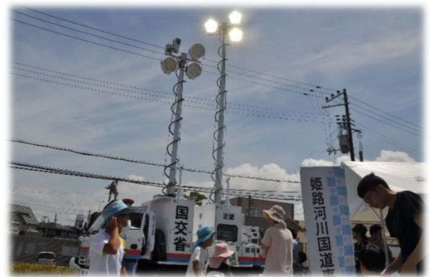
国土交通省 照明車