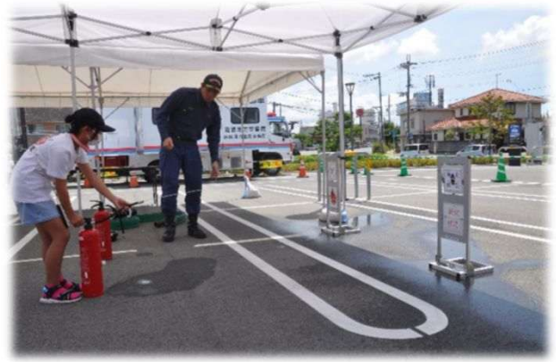
水の消火器で消火活動体験