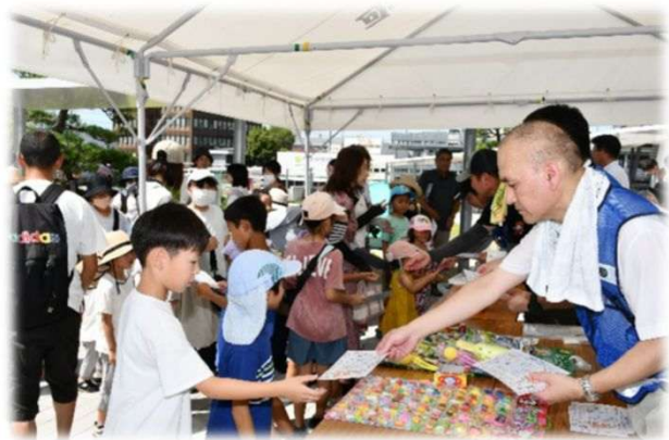
スタンプラリー受付