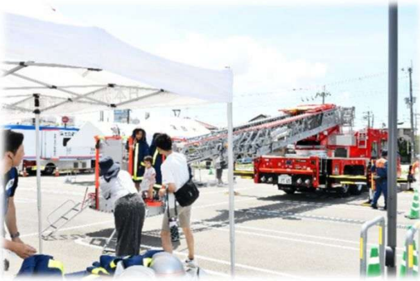
消防はしご車と記念撮影