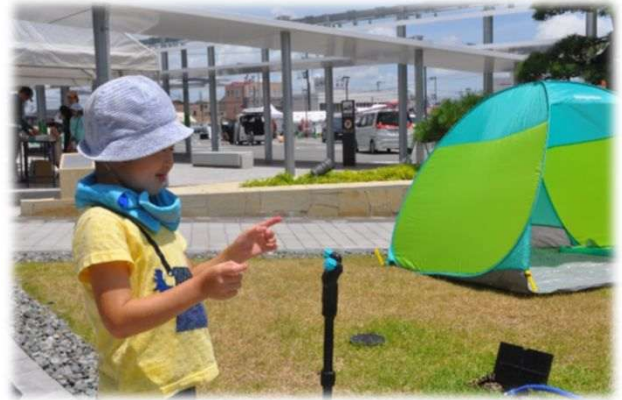
水遊びエリア ミストシャワー