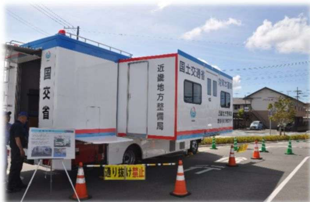
国土交通省 対策本部車