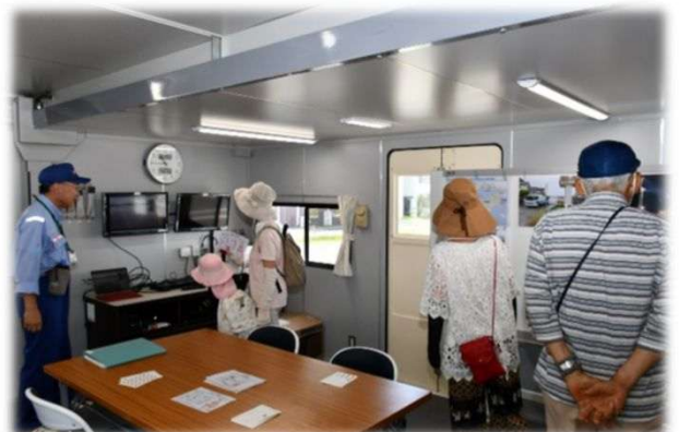
国土交通省 対策本部車（車内）