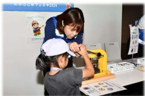
缶バッジ・マグネットづくり