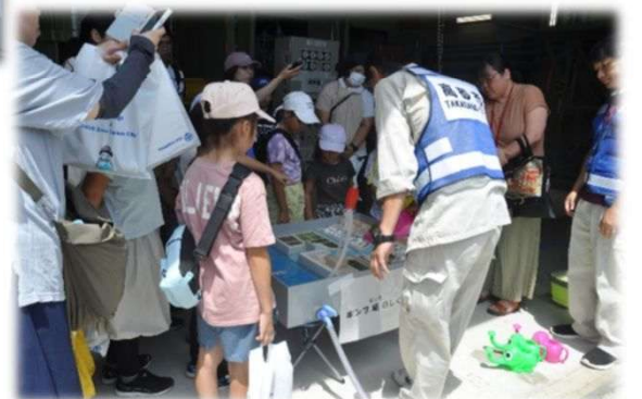
模型を使ってポンプ場の役割を説明