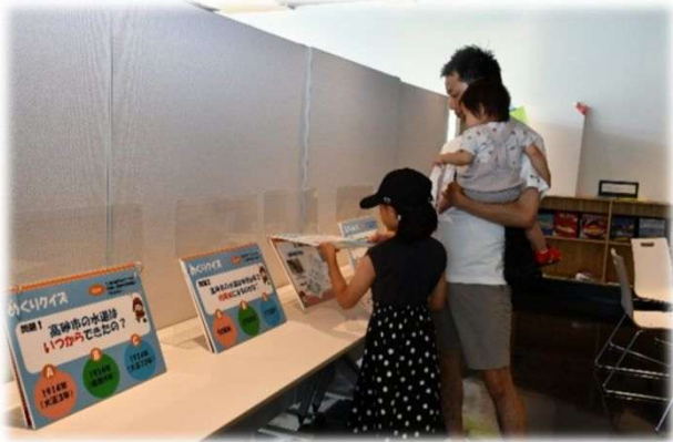
水道パネルクイズ