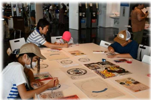
鉄ふたの展示・ぬり絵体験