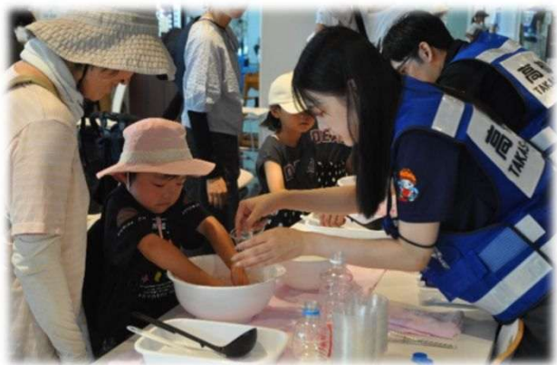
つかめる水づくり