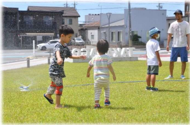
水遊びエリア スプリンクラー