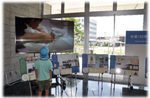
水道事業 動画上映・パネル展示