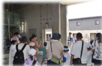
送迎バスで平成23年台風12号の被災状況を説明