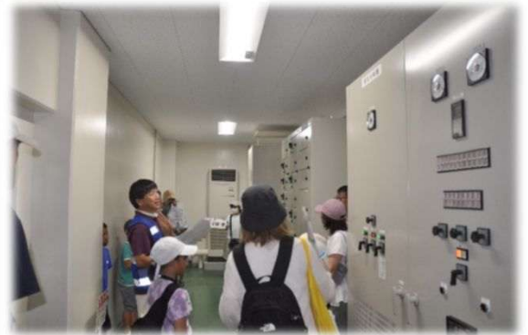
場内の各設備を説明