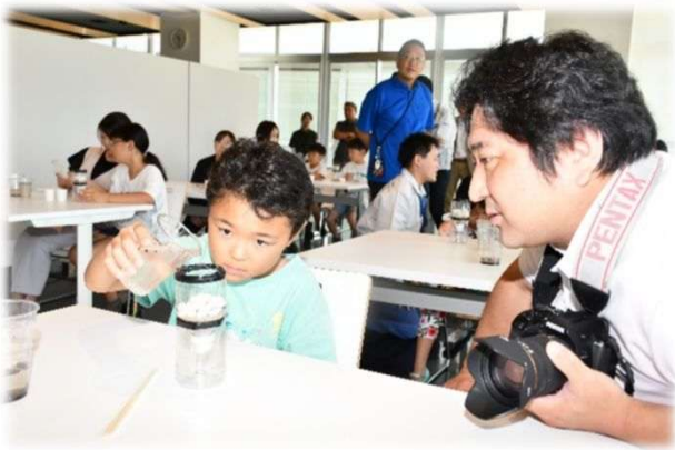
無人島で水を作ろう