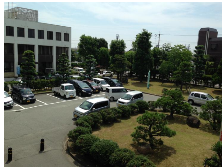
駐車場収容台数 (H26.7.25 現在)