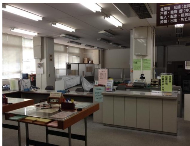
利用者の多い市民課の待合スペースは非常に狭く、混雑時には立って待つことになる。(本庁舎1階)