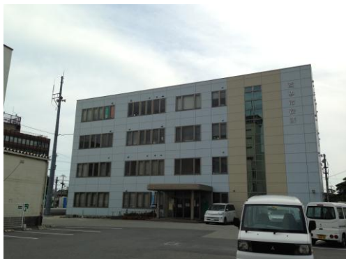
⑦西庁舎・防災センター