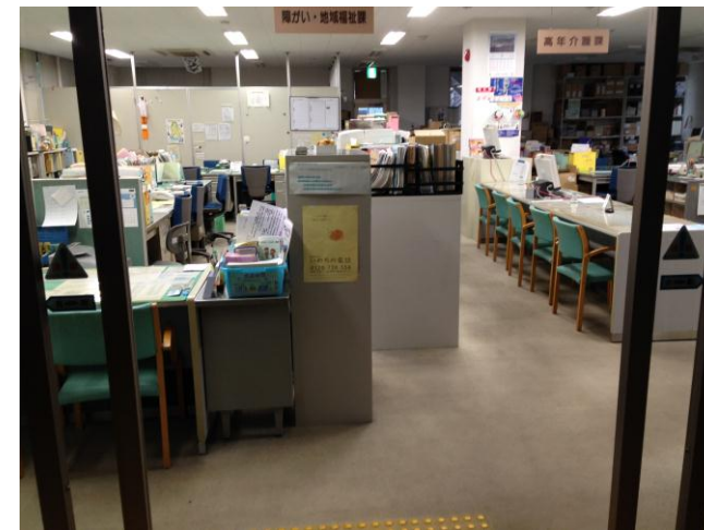
本庁舎から西庁舎へ福祉部門が移転したものの、業務の増加などで、通路や窓口が狭い状態になっている。(西庁舎1階)