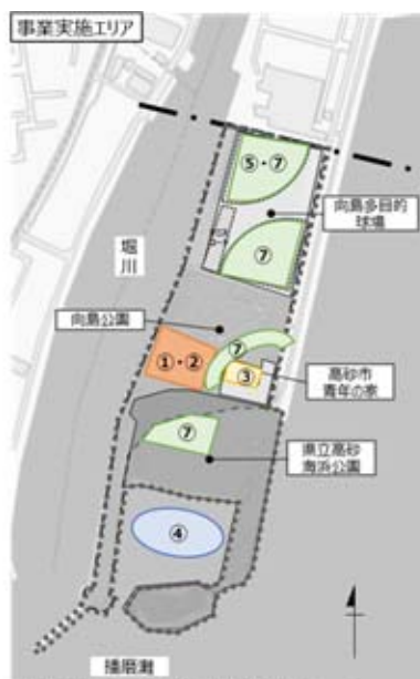
※地図上の色、数字は、左表と対応している。