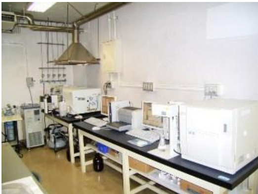
全有機炭素計及び原子吸光光度計

委託先である登録検査機関は、環境大臣が行う精度管理への参加が義務付けられており、それらの精度管理結果報告等の提示を要求し、審査します。